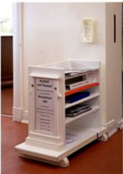
Internistenpraxis Am Borgweg